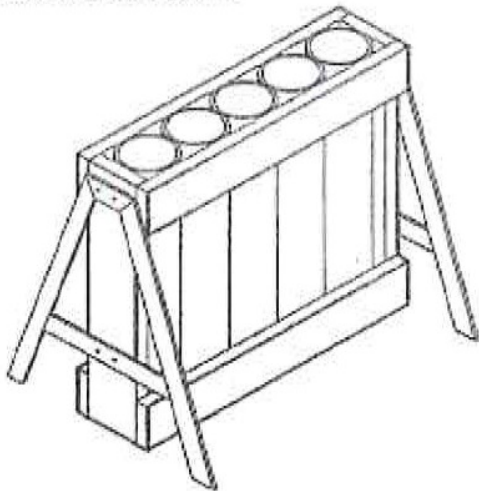
Fixation avec équerre